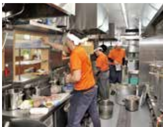
スタッフさんたちの活気あふれるオープンキッチン

🌸 日本有数の交通量を誇る国道16号線沿いに出店した鈴木ラーメン店さん。ロードサイドグルメの激戦区で、これからますます注目的になりそうですね。