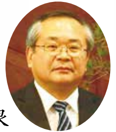
相模原税務署長 高橋 博良