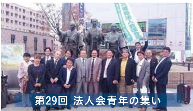
第29回 法人会青年の集い