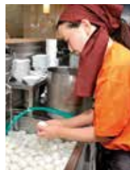
半熟味玉は1個税込 み108円