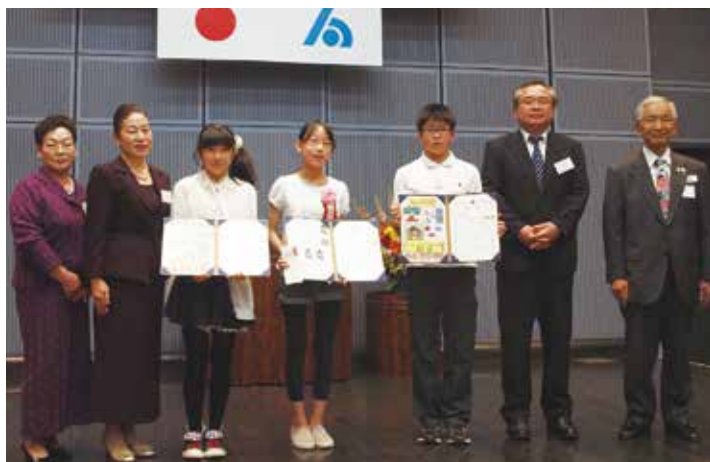
受賞者には、賞状と記念品が贈呈されました。

税に関する絵はがきコンクールは租税教育活動の一環として、わが国の将来を担う子供たちに税を正しく認識してもらうとともに、図画学習にも貢献するため、公益社団法人相模原法人会の女性部会が主体となり、学校生活の夏休みの宿題の一つとして相模原市内の72の小学校6年生5938名を対象に実施致しました。