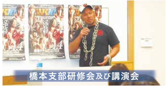
橋本支部研修会及び講演会

内容／税務研修会「マイナンバー制度について」講師／相模原税務署担当官 講演会「真壁刀義のスイートじゃねえ俺様人生」講師／新日本プロレスリング 真壁刀義氏 場所／ソレイユさがみセミナールーム2