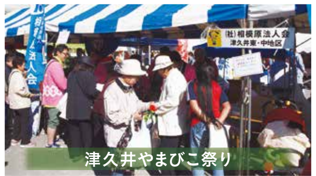
津久井やまびこ祭り

内容／税金クイズの配布、租税教育紙芝居、一億円の重さ体験 場所／相模原市立中野中学校