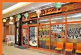
《博多中洲屋台 鈴木ラーメン店》 ボノ相模大野 サウスモール2F ボノ横丁