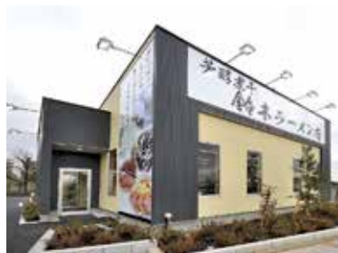
鵜野森交差点近くのモダンなお店

【鈴】店名にも掲げた通り、オーソドックスな煮干し系スープをメインにしています。一般的な片口イワシと、大きめサイズの平子イワシという2種類の煮干しを使い、1から10まで手