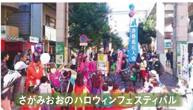
さがみおおのハロウィンフェスティバル

内容／税に関する資料の配布、「さるびあ亭か〜この紙芝居」 場所／相模大野駅北口商店街