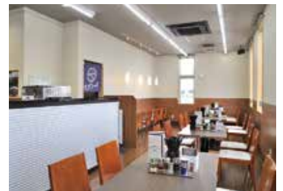
カウンター、テーブル、座敷席が揃う