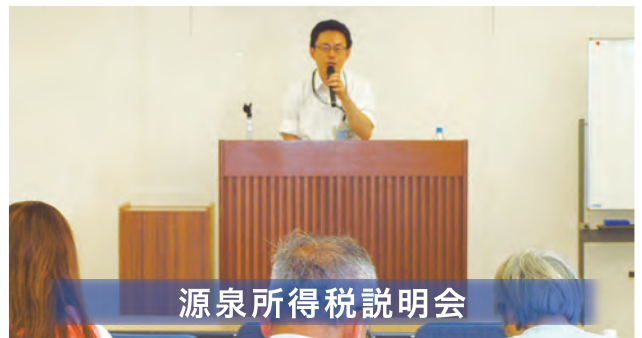
源泉所得税説明会

内容／平成27年度税制改正のあらまし・源泉所得税の誤りの多い事例 講師／相模原税務署 源泉担当官 場所／相模原法人会館