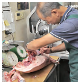
豚枝肉の骨抜きの様子。約20年使い続けている骨抜き包丁で、手際よく肉をさばっていく