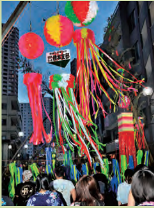
橋本の七夕まつり