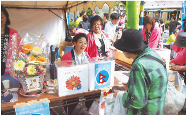
ネパール大地震の緊急支援募金活動