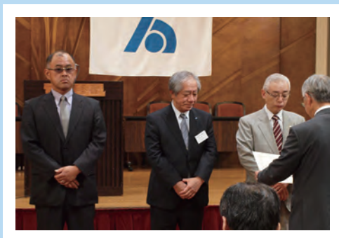
【地区(支部)の部】表彰者