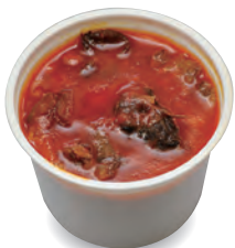
和牛のすじを煮込んだ人気の品

⑲ 良いものをリーズナブルな価格で提供する心意気が素敵なお小川ミートさん。日々の食卓の強い味方です。