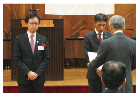
【福利厚生制度受託会社】表彰者