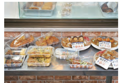
豊富なテイクアウトメニュー