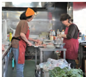
明るく元気なパートさん