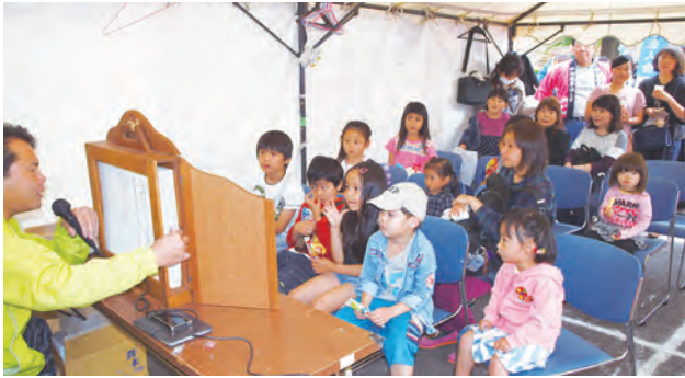
税に関する紙芝居の実施