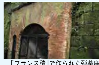
「フランス積」で作られた弾薬庫