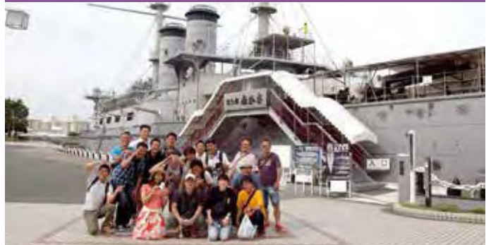
内容/三笠公園・猿島などを見学し地域社会や文化・歴史を学ぶ研修会