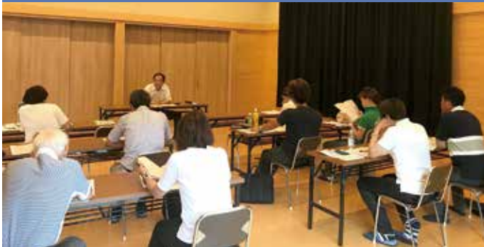
報告会/平成30年度事業報告及び決算報告2019年度事業計画及び収支予算報告・任期満了に伴う役員改選について 研修会/改正税法(消費税)について 講師/相模原税務署担当官 場所/二宮神社