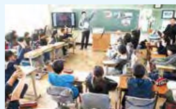
緑台小学校での租税教室