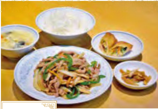
チンジャオオロス 青椒肉絲の お得セット