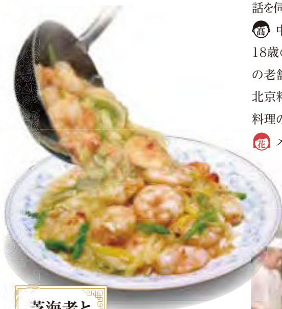
芝海老とカニ肉の炒め

高 セットは種類が豊富で、ランチメニューは曜日や週によって変わります。ご家族連れのお客さまに人気の『青椒