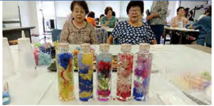
ハーバリウムと私たち「どっちがキレイ？」