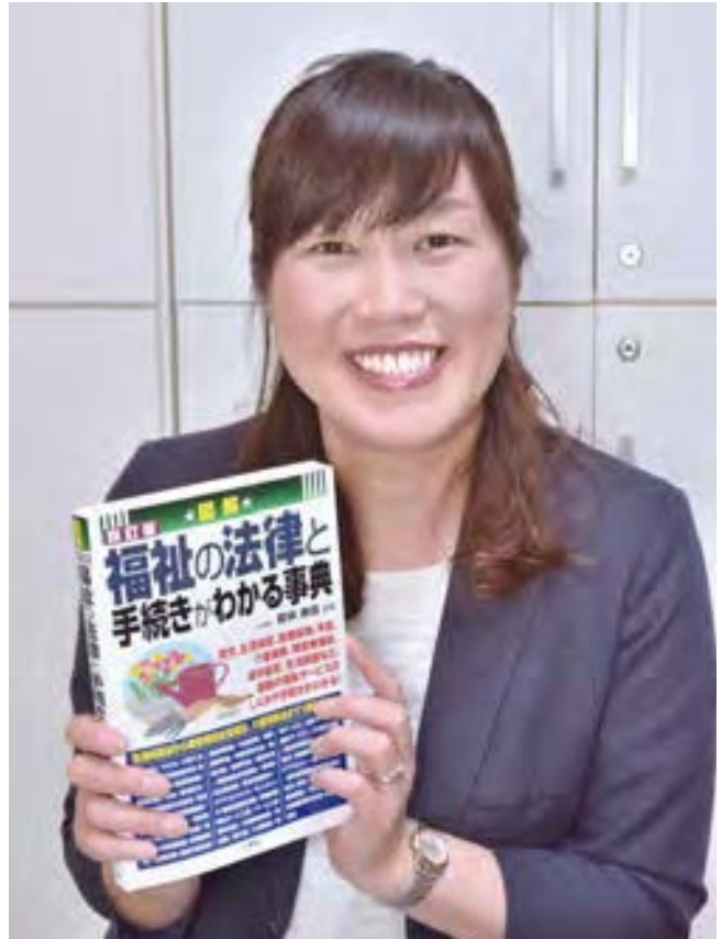
福祉の法律や介護福祉、障害福祉についての著書及び監修本多数出版

当時ホームページのある事務所はまだ少なく、社会福祉法人に特化していることをひたすら発信し続けたところ、老舗老人ホームの理事長先生の目に留めていただくことができました。そこから仕事の縁、人の縁が広がっていった恩は今も忘れられないと言います。