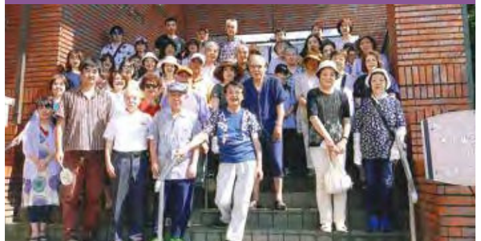
内容/ワイナリー工場見学と花火大会観覧 場所/シャトー勝沼・道の駅とよみ・市川三郷町