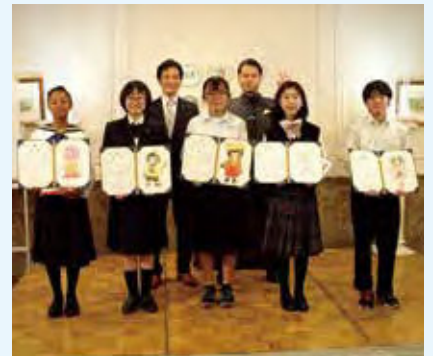
ねぐちゃんイラスト募集 優秀賞 表彰式