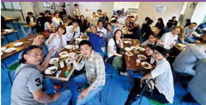
内容/大野南支部会員親睦バーベキュー大会 場所/カルチャービル 駐車場