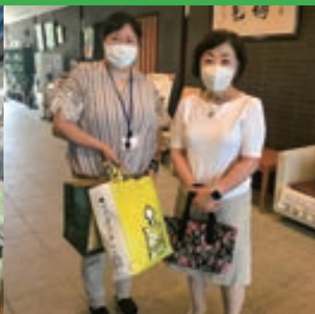
特別養護老人ホーム 緑JOY