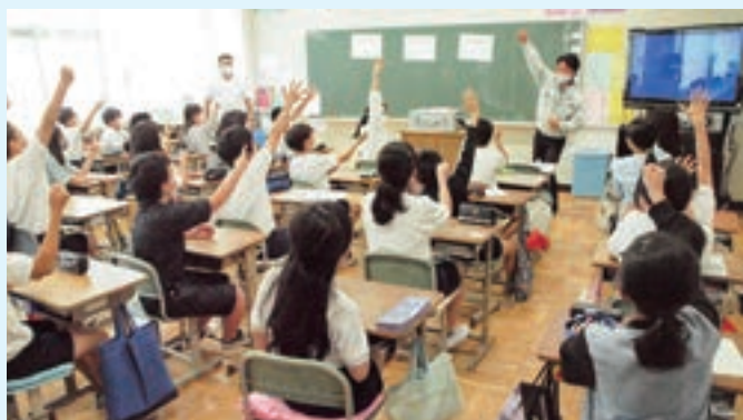
6月2日 大野台中央小学校