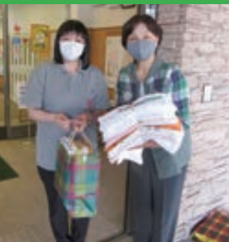
よもぎの里愛の丘