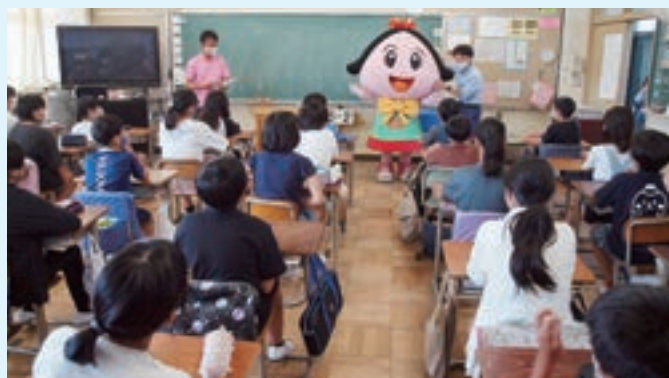
6月29日 上鶴間小学校