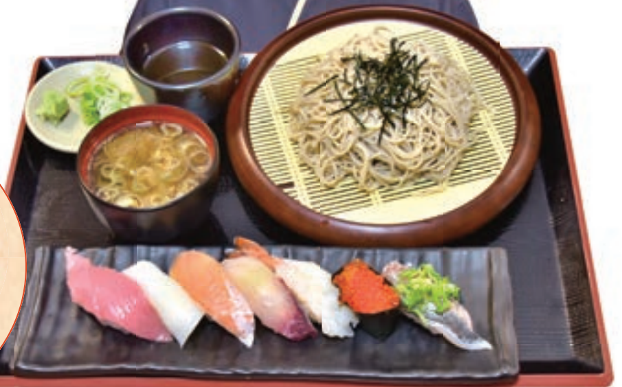
上ランチ寿司ざるそばセット