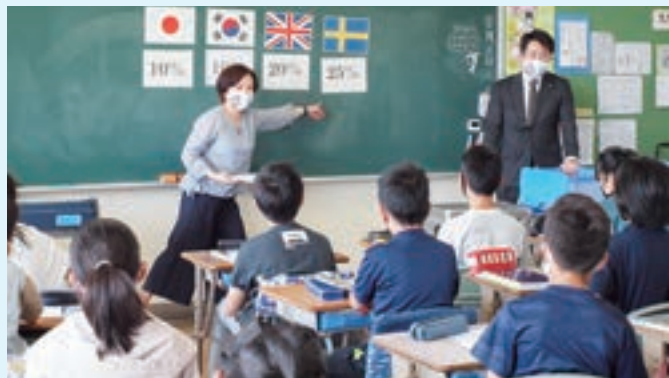
5月25日 大野北小学校