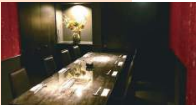
VIPルーム「牽牛」10名 1室完全予約・完全個室の特別な空間。 1日一組限定