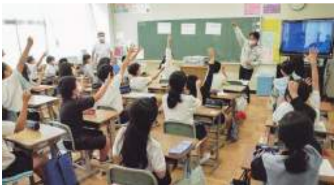
6/2(木) 大野台中央小学校