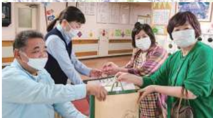
5/10(火) ライフホーム城山