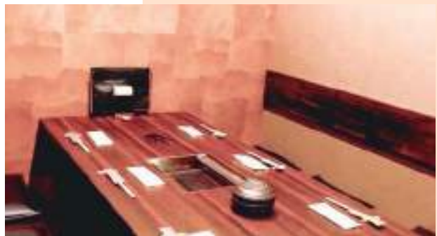
個室、半個室など落ち着いた空間で美味しい食事とお酒をゆっくり楽しめる