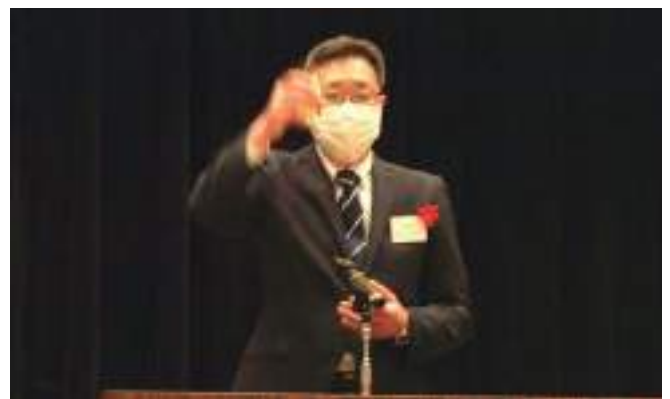
相模原税務署大口副署長による乾杯