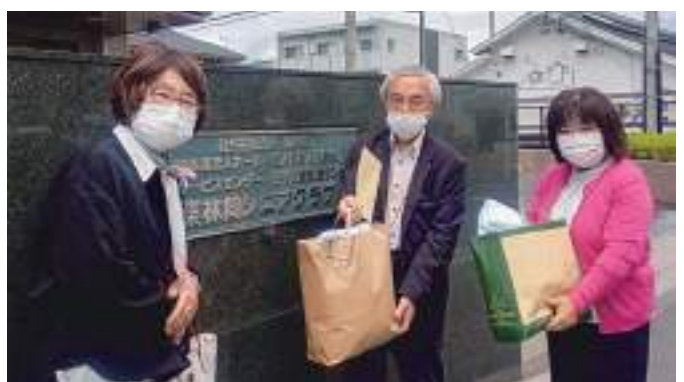
5/12(木) 特別養護老人ホーム東林間シニアクラブ