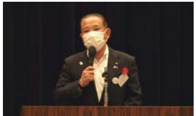
相模原市長 本村賢太郎 様