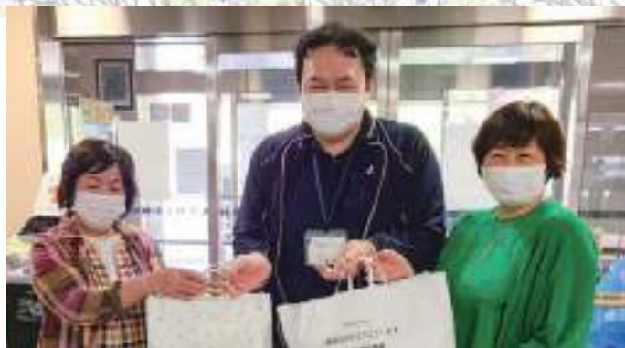
5/10(火) 特別養護老人ホーム青根宛1号館・2号館