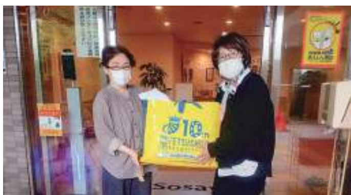
5/12(木) コミュニティホームピノ