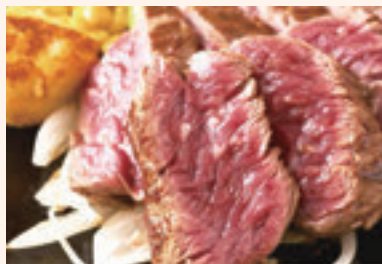
特選ステーキ/シングル(100g) ¥1,342