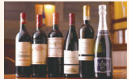
気軽にお楽しみいただけるワインから特別な日にぴったりなボトルワインも各種ご用意