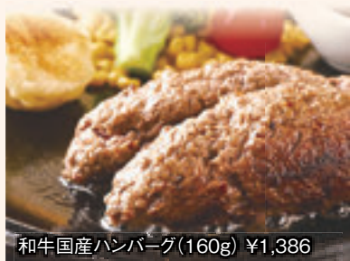
和牛国産ハンバーグ(160g) ¥1,386

松 ステーキは通常期は稀少部位のシャトーブリアン、上質なオーストラリア産グレインフェッドビーフ、米国産プライム