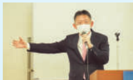
わかりやすく丁寧に話す高岡署長

官を歴任されていたこともあり「税 と国境～国家間の競争から協調へ ～」という国際的なテーマでお話 いただきました。グローバル化が進 み、税源を巡る国家間の争奪戦や、 租税回避地に税収が奪われるなど の問題が発生する中で、国際社会が 協力し新しい国際課税ルール作成の 動きがあることなど、視野の広い話 をお聞きすることができました。来 年こそ新型コロナウイルス感染症が収