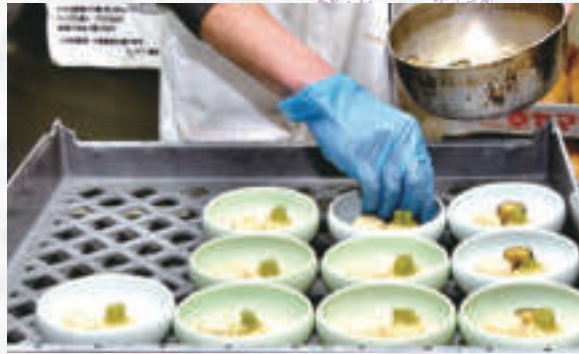
加熱調理室で作られた料理は盛り付け室でお弁当やオードブルに。

いただけています。クオリティーと味と価格がマッチしているということで、リピートしていただけているのかなと、ありがたく思っています。