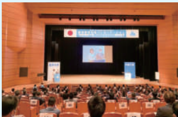
全国青年の集い当日の様子

今回から始動した『健康経営大賞』プレゼンも選ばれた企業、部会員についてもとても素晴らしい活動内容と報告を頂きました。