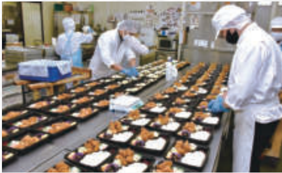
唐揚げ弁当100個の注文も約20分で手際よく盛り付けられて配達されます。ボリューム満点!