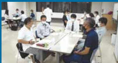
青年部会経営研修会