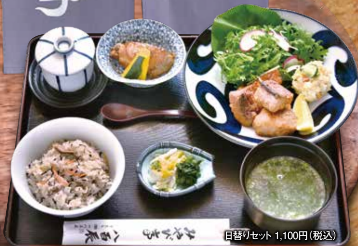
日替りセット 1,100円(税込)