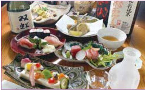
あおいコース(料理6品)3,850円(税込) ※飲み物は含まれません ※1階テーブル席のご注文のみとさせていただきます