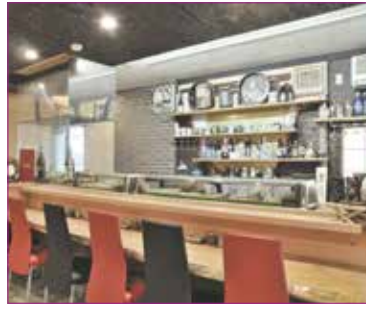
伝統と新しさが調和する和空間 HPには店内ストリートビューもあるので各室を確認できる