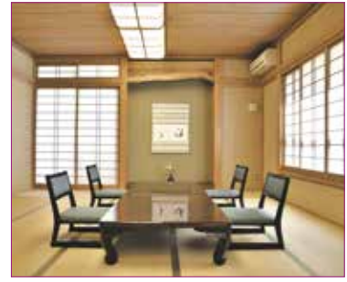
エレベーターで上げられる2階には様々な人数に対応できる座敷

の文字も書いてくださいました。律儀な御方で、喜寿や出産時など、何かしらの節目にご挨拶に伺ったり、お手紙をしたためると、お礼の電話をかけてきてくださいます。