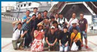
おもしろカレッジ