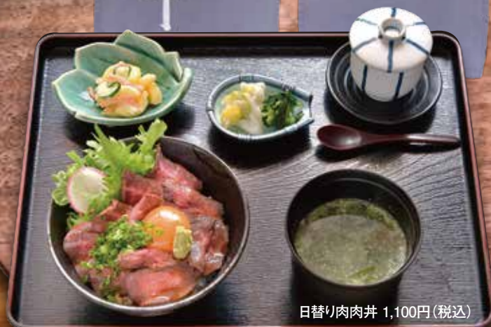
日替り肉肉丼 1,100円(税込)