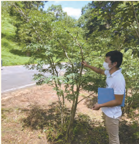
生産者の畑で植栽する植木の選別