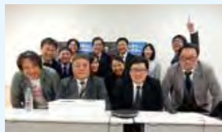
ご協力いただいた方々