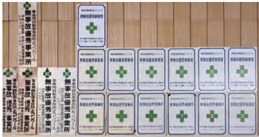
無事故優秀 事業所の証が並ぶ