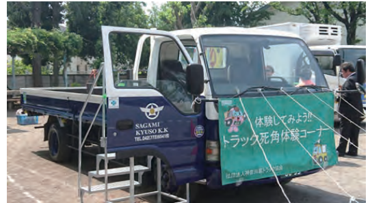
交通安全教室で死角体験に活用