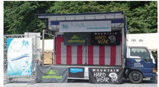
イベントのステージとして活用

一方、その時代によってニーズが生まれるものを運ぶものなんです。僕が入社してから10年ほどは引越し業を手がけていました。今は鋼材に特化しています。