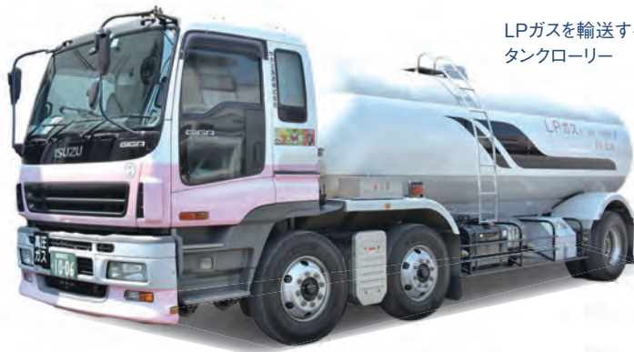
LPガスを輸送する タンクローリー