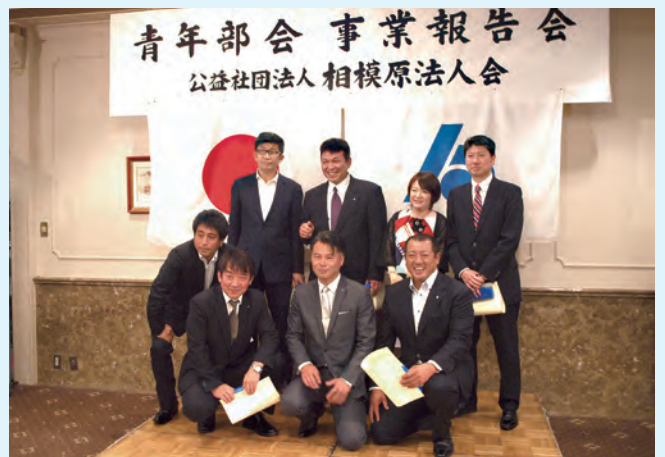
平成29年度卒業生は11名 沢山の思い出をありがとうございます