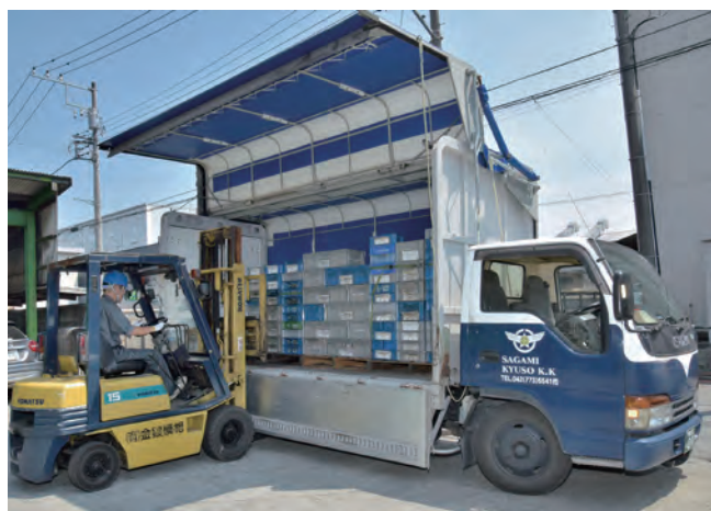
安全かつスピーディーな荷積み作業