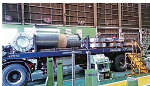
自動車用 鋼板輸送