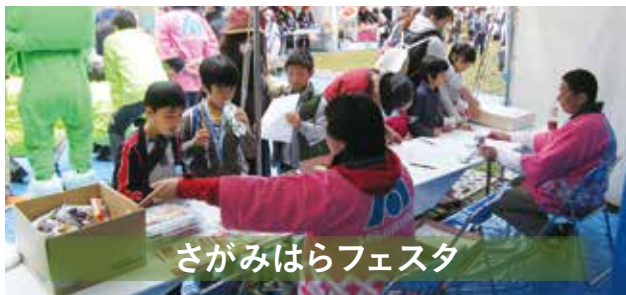
さがみはらフェスタ