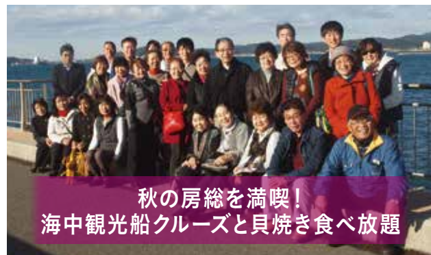
秋の房総を満喫！ 海中観光船クルーズと貝焼き食べ放題

内容 / 常楽山萬徳寺を参拝後、貝焼き食べ放題を満喫し、渚の駅たてやまを見学 場所 / 萬徳寺、漁師料理たてやま、渚の駅たてやま