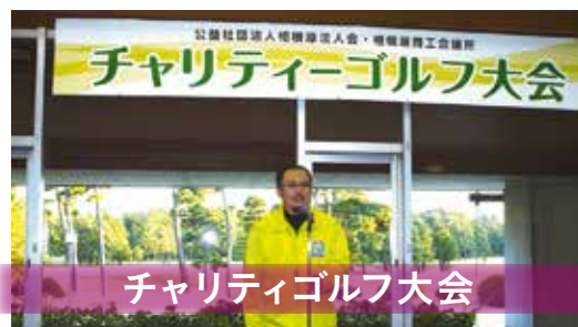
チャリティゴルフ大会

内容 / 地域の社会福祉への寄付・東日本大震災、熊本地震支援としてのゴルフ大会 共催 / 相模原商工会議所 場所 / 相模原ゴルフクラブ