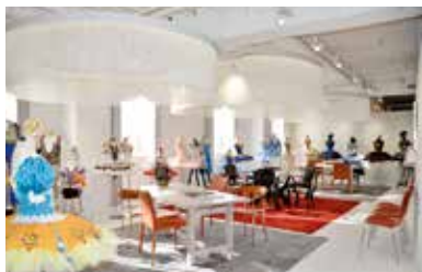
京王新線「幡ヶ谷」駅直結のアトリエヨシノ新宿オフィス