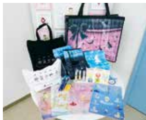
アトリエヨシノ、オリジナルグッズ。衣裳ケースなどバリエーション豊富