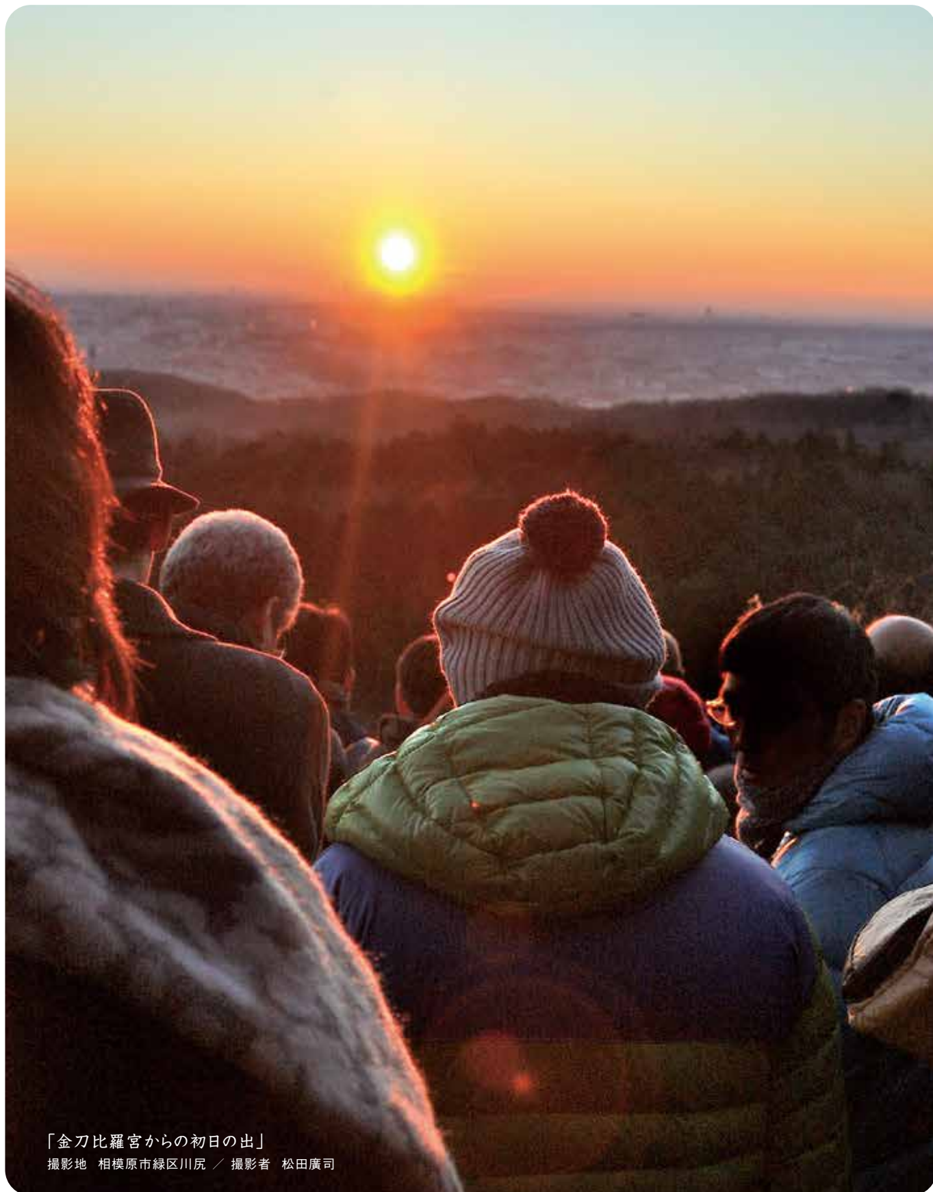
「金刀比羅宮からの初日の出」