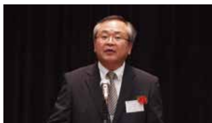
相模原税務署長 高橋博良 様