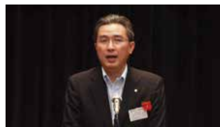
相模原市 副市長 古賀浩史 様