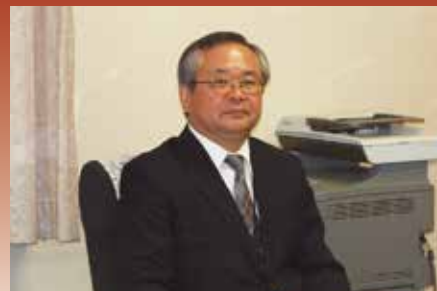
相模原税務署長 高橋 博良