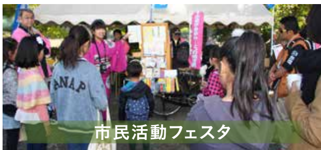
市民活動フェスタ