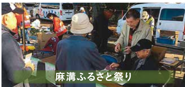
麻溝ふるさと祭り