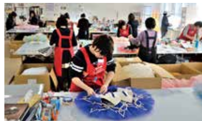
検針や衣裳のメンテナンスなどは、スタッフが1着1着、手作業で細かいところまで目を通す