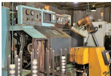
旋盤とロボットの併用で自動化

④ いいモノができるのは、それだけでうれしいことですし、技術が上がることもうれしいことです。今でも向上したいです。汚れ仕事だけどやりがいを感じる仕事です。