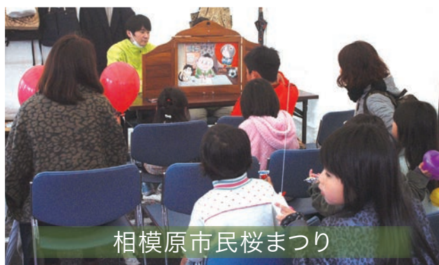
相模原市民桜まつり

内容 / 税金クイズ及び税に関する資料の配布、一億円の重さ体験、租税教育用「紙芝居」を実施しました。 会場 / 市役所桜通り