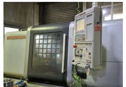
コンピュータ制御のNC旋盤