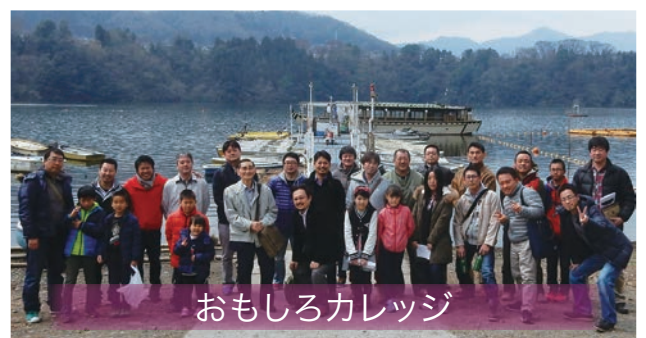
おもしろカレッジ

内容／津久井湖を屋形船で遊覧、プレジャーフォレストでBBQ・温泉・イルミネーション 場所／相模原市緑区内