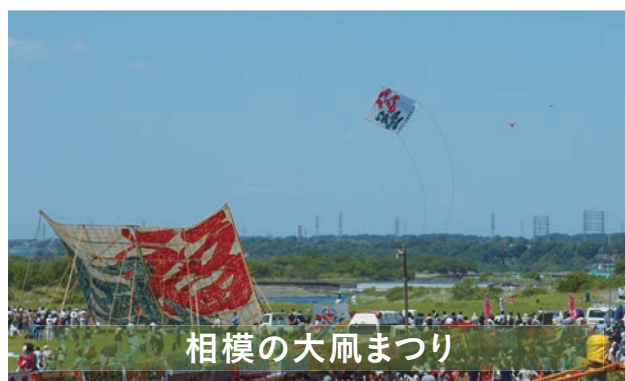
相模の大凧まつり

今年も三間四方法人会の大凧「公益」を揚げて、親睦を深めました。 場所 / 新戸スポーツ広場(相模川架架依橋上流)