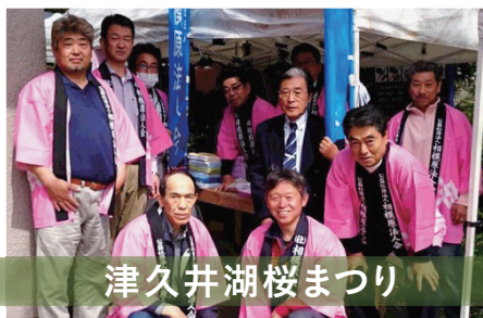
津久井湖桜まつり