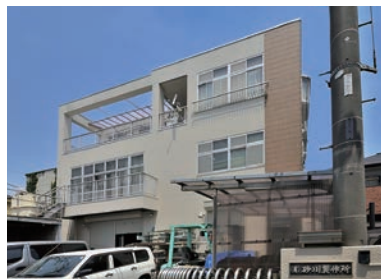
創業以来45年間金属加工ひと筋