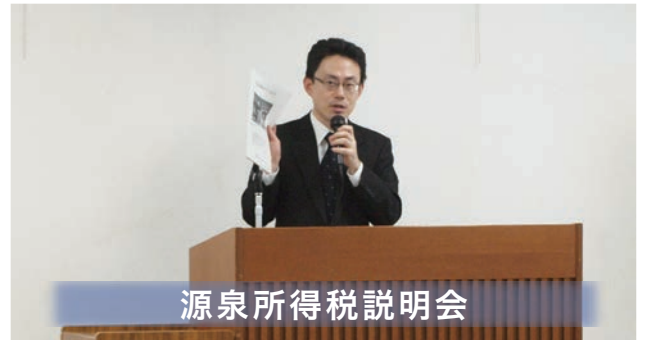
源泉所得税説明会