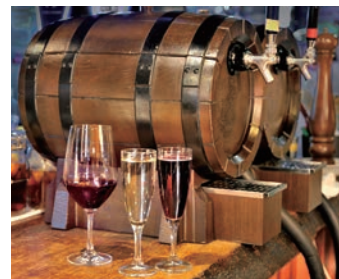
自慢の樽生ワインのサーバー