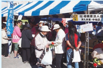
津久井やまびこまつりの様子 10/25