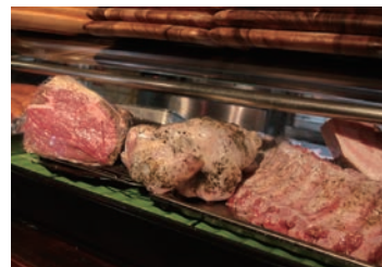
牛・豚・鶏・ラムからジビエまで、美味しい食材を取り寄せています