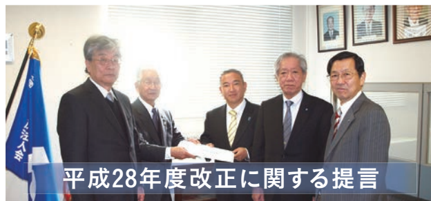
平成28年度改正に関する提言