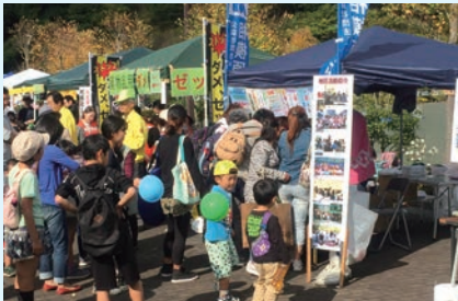
相模湖ふれあい祭りの様子 10/18