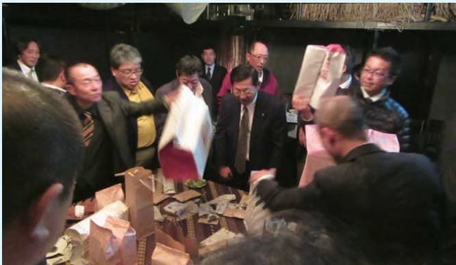
税金クイズで正解した部会員が賞品を物色

相模原駅、Gardenia(イタリアン×エスニック料理)にて新年会を開催致しました。私自身入ったことがないお店でしたので何