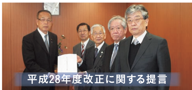
平成28年度改正に関する提言