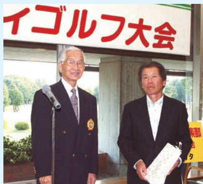
稲場会長と優勝者

秋の恒例事業の一つ、相模原商工会議所との共催にて「第22回チャリティゴルフ大会」を相模原ゴルフクラブにおいて開