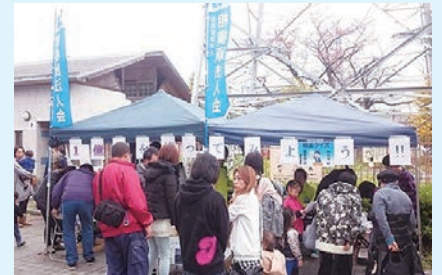
津久井湖上祭の様子 11/22