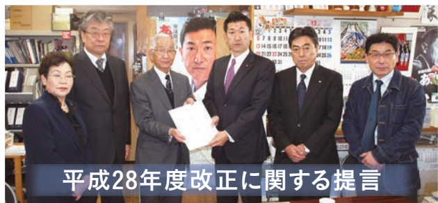
平成28年度改正に関する提言