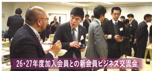
26・27年度加入会員との新会員ビジネス交流会