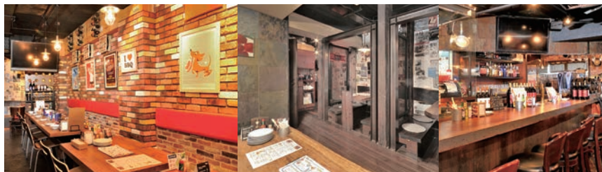
店内のコンセプトは「倉庫の中で寛げる大人の酒場空間」。レンガに囲まれたスタイリッシュなメインベースは大人数様でのご利用に最適です。他にカウンター席や掘りごたつの個室も。全席70名

【太】 いろいろ食べてみたいくなります。メニューの変わる楽しみもあって、何度でも足を運びたいくなりますね。