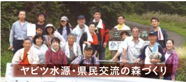
ヤビツ水源・県民交流の森づくり

県法連社会貢献運動ヤビツ水源・県民交流の森づくり 秦野市寺山地内ヤビツ峠【法人会の森】の下草刈りを実施しました。