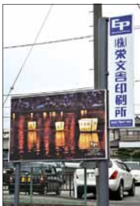
社屋前の看板は相模原市の季節を感じる風景写真に毎月貼り替えています。社員は全員地元から通っている、地域に根ざした会社です。

🌸 ポスターやカタログ、会社案内、小冊子、伝票類といったものから、看板や販売促進グッズなども作ります。印刷だけではなく、撮影や取材も含む企画からのデザイン制作も承っています。早く、安く、クオリティの高い物作りを目指しています。