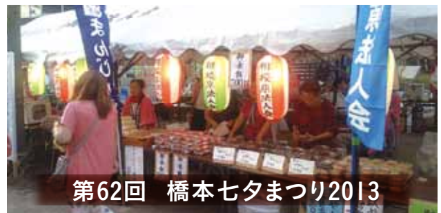
第62回 橋本七夕まつり2013

5基の飾りを掲揚し、復興支援の七夕まつりチャリティーイベント「がんばろう日本」を開催しました。竹飾りコンクールにおいて大賞を受賞しました。