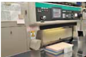
大型カラー印刷機、製本システム、個人のお客様に対応するためのオンデマンド印刷機も。

をいただいております。 ❶ 印刷屋さんというのは納期に合わせるのが大変なんでしょうね? ❷ 納期の厳しさはありますが、制限の中で最高のものを作るよう努力しています。受注生産なので既製品にはない、創造する喜びがあります。作った後にお客様から「ありがとう」と言ってもらえるのは、仕事冥利に尽きますね。 ❸ 読者の皆様になにかメッセージはありますか? ❹ ホームページをご覧になられたお客様からのお問合せが多く、できるだけご要望を商品化する努力をしています。特に会社案内をご注文いただいたお客様から製品案内、カタログ、展示会のパンフレットなどのご相談が増えご予算、ご希望に合わせた商品をご提案させていただきます。今後はこれらの商品をさらに「早く、安く」ご提供できればと思っています。また、個人のお客様からの少数印刷から、大量ロットまで幅広く対応していますので、お気軽にご相談ください。