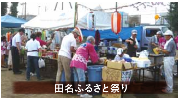
田名ふるさと祭り

会場/田名中学校グラウンド 租税教育用冊子と風船の配布、バザー販売を行いました。