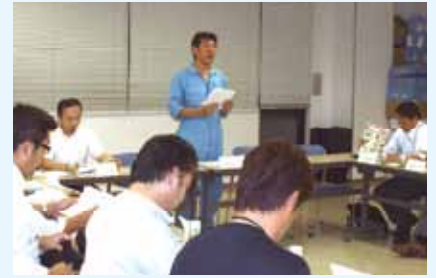
浅野部会員(車両の整備、販売業について)

真を見せていただきながら解説をしていただいたり、素材の強度などわかりやすく解説してくださいました。