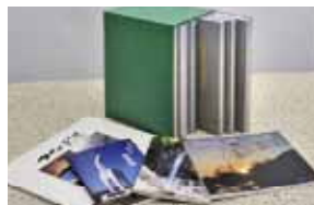
写真集、自分史、遺稿集など、自費出版のご注文も増えています。1冊からご注文いただけます。