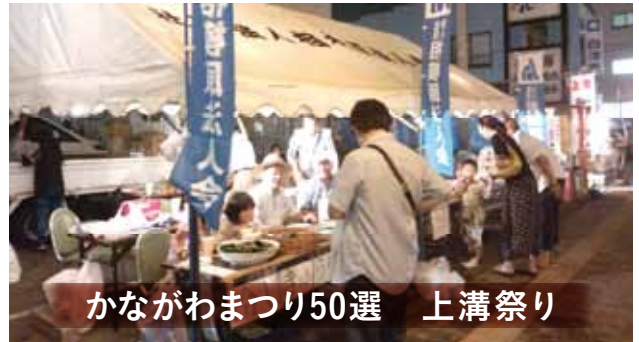
かながわまつり50選 上溝祭り

会場/上溝商店街 ホテルウイング相模原 法人会のPR活動、募金や物品販売を行いました。