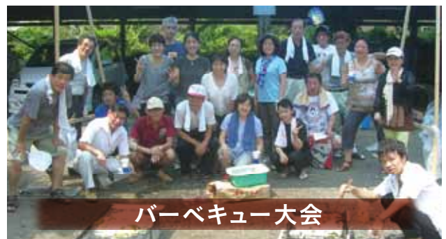
バーベキュー大会