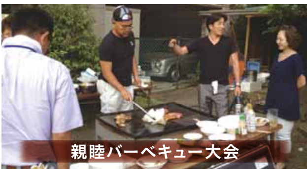
親睦バーベキュー大会