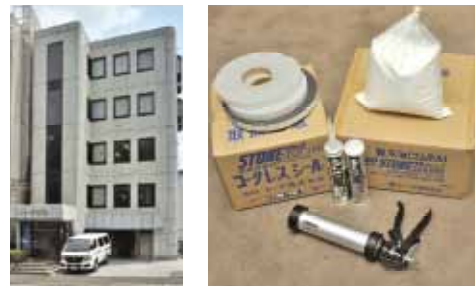
トーア株式会社の社屋と製品

そんな中でも、「お前の仕事ぶりは知っているから」と数社から仕事をいただき信頼を得て、独立採算できるまでに成長しました。一度トーアから抜けて、のれん分けした子会社「ジェック」の経営者となりましたが、先代から後継者として戻って来てほしいと頼まれて、トーアの経営も引き受けることになりました。