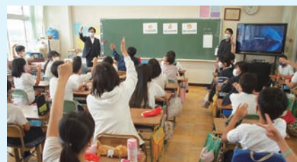
大野台中央小学校