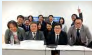
ご協力いただいた方々